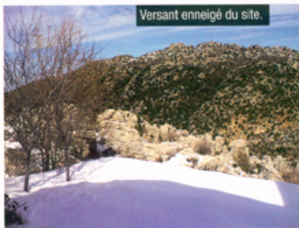
Versant enneigé du site.

milieu. Elle encourage le tourisme archéologique, la découverte des spécificités culturelles et proposera bientôt des chambres d'hôtes, à bas prix, chez l'habitant, où l'on consommera les produits du terroir. Une partie des bénéfices aidera à la rémunération des guides locaux. « L'activité touristique doit profiter en premier, à l'ensemble de la communauté locale ».