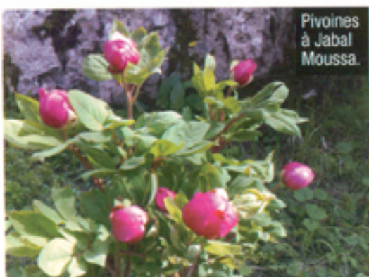
Pivoines à Jabal Moussa.