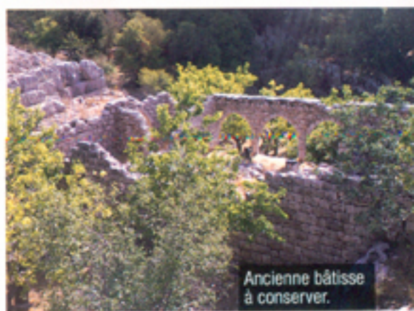
Ancienne bâtisse à conserver.